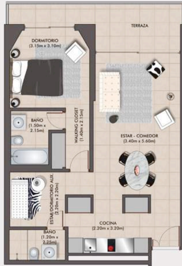
VISTA PUNTA BALLENA

1 y ½ dormitorios - área total: 78 m 2 - (propiedad individual + terrazas, muros, ductos, cuota de palier)