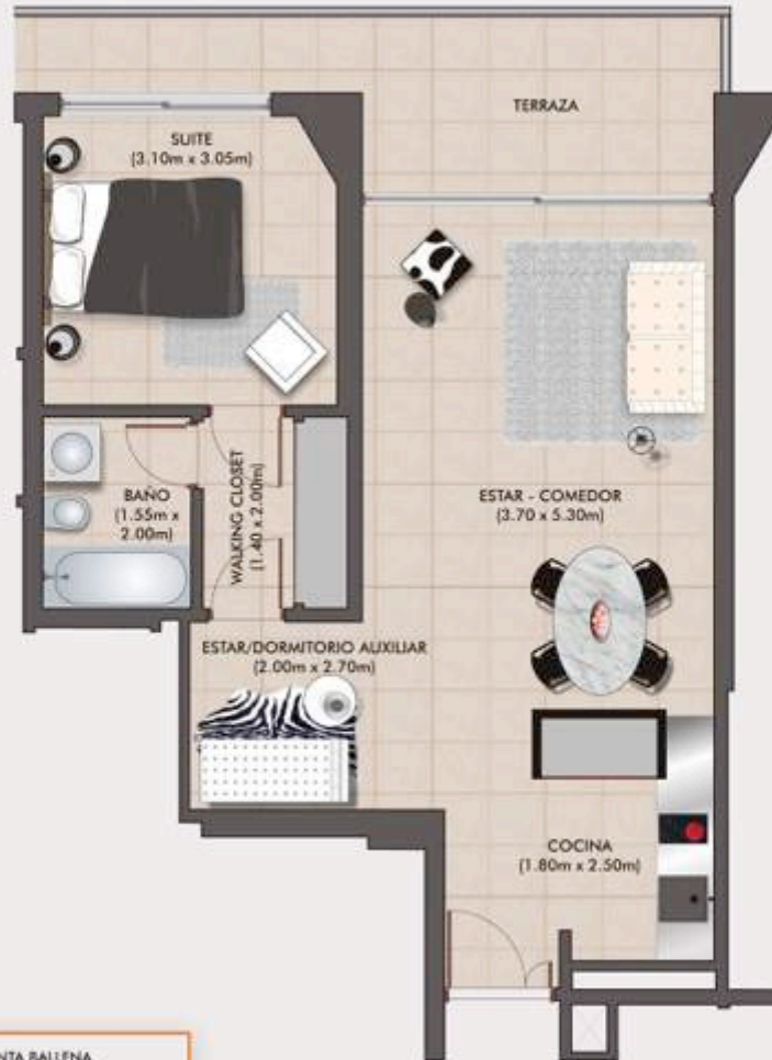
VISTA PUNTA BALLENA

1 y ½ dormitorios - área total: 73 m 2 - (propiedad individual + terrazas, muros, ductos, cuota de palier)