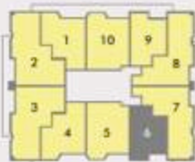
VISTA PLAYA BRAVA